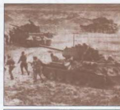
Вторая мировая война