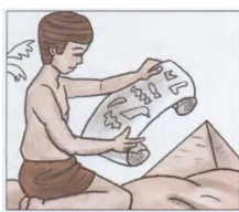
Календарь на 365 дней