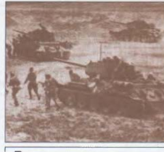
Вторая мировая война