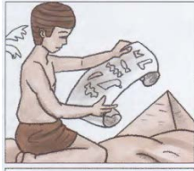
Календарь на 365 дней